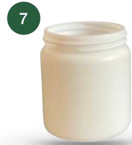
Especial Vitrolero R-95