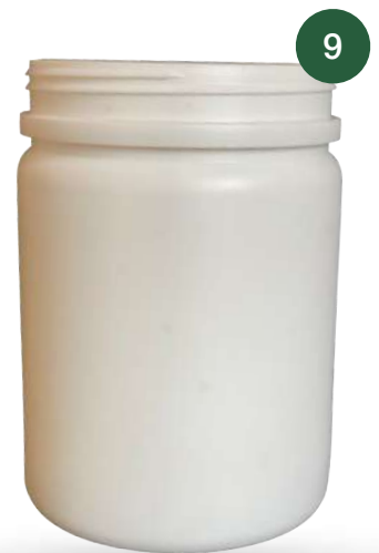
Especial Vitrolero R-140